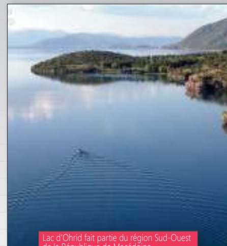
Lac d'Ohrid fait partie de la région Sud-Ouest de la République de Macédoine

Cette coopération sera facilitée par l'introduction d'un nouvel axe « Tourisme » qui reprendra les travaux de l'ancien axe « Tourisme durable ». Il s'agit ici de travailler sur la création d'une stratégie de développement du tourisme de la région Sud-Ouest et de contribuer au renforcement des capacités des autorités locales dans le domaine du développement du tourisme.